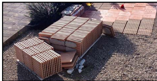
El Memorial després de patir l'atemptat

trabajar para sus cinco hijas, para darles un poco de comida. Estos malditos nos dejaron en la pura miseria, en el desconsuelo y la desgracia; “callar y callar”, y además ahora nos quitan lo único que podemos poner: su nombre en una baldosa. Nos quieren borrar la memoria. Seguro que los que han hecho esta aberración han dejado muy claro como son; a todos les deseo, que cuando se reúnan, tengan la mitad del dolor que tenemos nosotros. Estas heridas no vamos a cerrarlas nunca. Se ve que no tenéis conciencia,