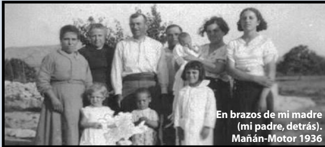
En brazos de mi madre (mi padre, detrás). Mañán-Motor 1936