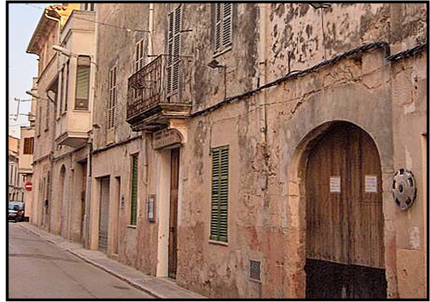
Magatzem de la Cooperativa “La Nueva Vida” situat al Carrer de Sant Joan. Destinat actualment a local social d'una associació de la 3ª edat

Val a dir que els socialistes van ser els principals impulsors de la constitució de cooperatives de consum fins l'esclat de la Guerra Civil l'estiu de 1936. La precarietat i la feblesa econòmica de moltes famílies, que no podien fer front a la carestia de vida amb els baixos salaris obrers, foren el principal motiu que portà a gran part de la classe obrera a organitzar-se per tal d'ajudar-se mútuament 3 . Una mos-