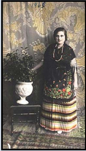
Mi madre a los 18 años aprox. con el traje regional de Pinoso (Alicante).

Y sigue mi madre... "Yo me fui con mi abuela paterna y mis padres pusieron una criada y