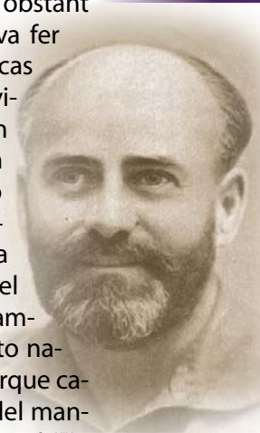
Alfonso de Zayas Bobadilla