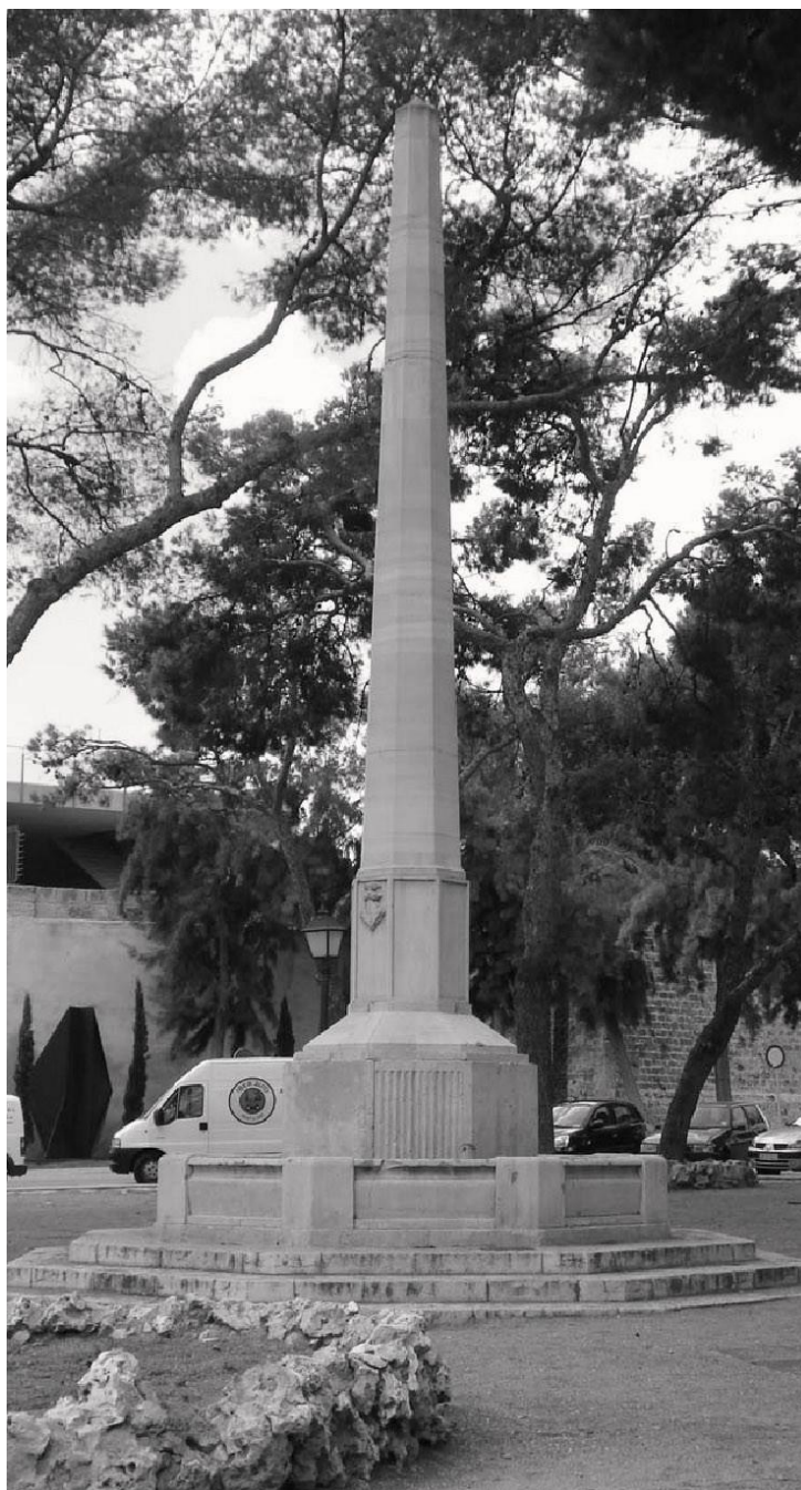
Plaça de Santa Catalina Monòlit Jinetes de Alcalá