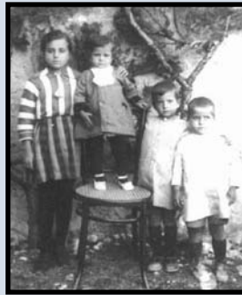
Mi madre con sus hermanos