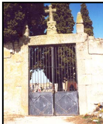
Puerta del cementerio donde se supone yacen los restos de mi tío en una fosa común

Terminaré diciendo –y deseando– que el levantamiento de las fosas y la dignificación de las víctimas por parte del Estado sea un hecho. ■