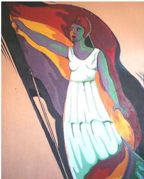
"La República", pintura de Josep Suárez Ferrer

Des d'Àfrica, el general Francisco Franco Bahamonde, al front de l'exèrcit desplaçat al nord d'Àfrica, junt amb unes forces especials de xoc