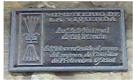
Col·locada a principis dels 70 a unes vivendes de la Plaça Rector Sebastià Jaume d'Alaró.

Les possibles solucions a aquest problema son variades. Una, es l'eliminació de tota la simbologia als llocs públics, l'altra la democratització monumental i la darrera, la museïtzació i contextualització històrica dels monuments i demés. Cada una d'aquestes solucions, es aplicable, però, pensem que la millor solució, es aquella que pugui adaptar el millor de cada una de les solucions possibles. Esta clar, que cada monument, tindrà una actuació concreta i personalitzada. A més s'ha d'aplicar una normativa acord amb els valors democràtics vigents actualment a l'estat espanyol, i que son la font de l'autentica convivència entre els ciutadans i ciutadanes del món. Aquest es un pas valent, que ha de menester el concurs de totes les institucions implicades, tant municipals, com autonòmiques i estatals, i la col·laboració de la societat civil, que en sortirà democràticament reforçada. ■