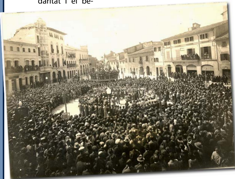
Proclamació de la República a Llucmajor

Finalment, la Junta Directiva de l'Associació Memòria de Mallorca vol expressar la més sincera gratitud als accionistes de La Nueva Vida que han fet possible la cessió del local. ■