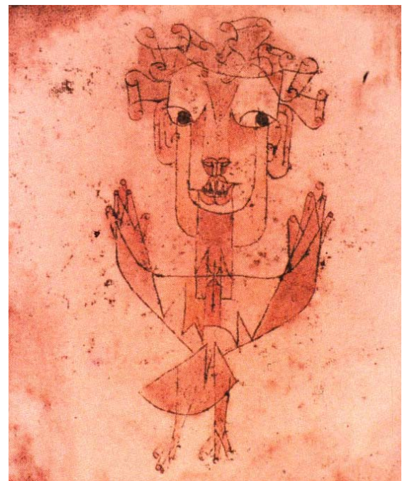
L'Angelus Novus de Paul Klee.

Per Benjamin qualsevol document de cultura és un document de barbàrie, en la mesura que cultura i barbàrie estan estretament articulades. L'esplendor de les catedrals gòtiques és testimoni de la sang i la suor d'aquells que la construïren. Els nostres drets i llibertats, recollits en les nostres constitucions, són testimoni dels morts que ha costat assolir-los. I tan sols farem justícia amb ells, si és possible, reconeixent-ho. Amb el cas de la Memòria Històrica passa el mateix, i, a la vegada, diferent. És un passat, la història d'unes víctimes, que tan sols no està ni documentada. Això és el més ignominiós. I l'Asso-