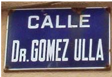
Metge Militar que serví a les ordres de Franco. Placa d'un carrer d'Alaró.

"Y en los lugares de la lucha donde brilló el fuego de las armas y corrió la sangre de los héroes, elevaremos estelas y monumentos en que grabaremos los nombres de los que con su muerte, un día tras otro, van forjando el templo de la nueva España, para que los caminantes y viajeros se detengan un día ante las piedras gloriosas y rememoren a los heroicos artífices de esta gran patria española" (Francisco Franco. Discurso de unificación. Salamanca, 19 de abril de 1937)